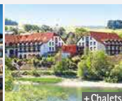
Göbel's Seehotel Diemelsee 34519 Diemelsee-Heringshsn.