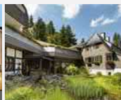
Romantik Hotel Stryckhaus 34508 Willingen/Upland