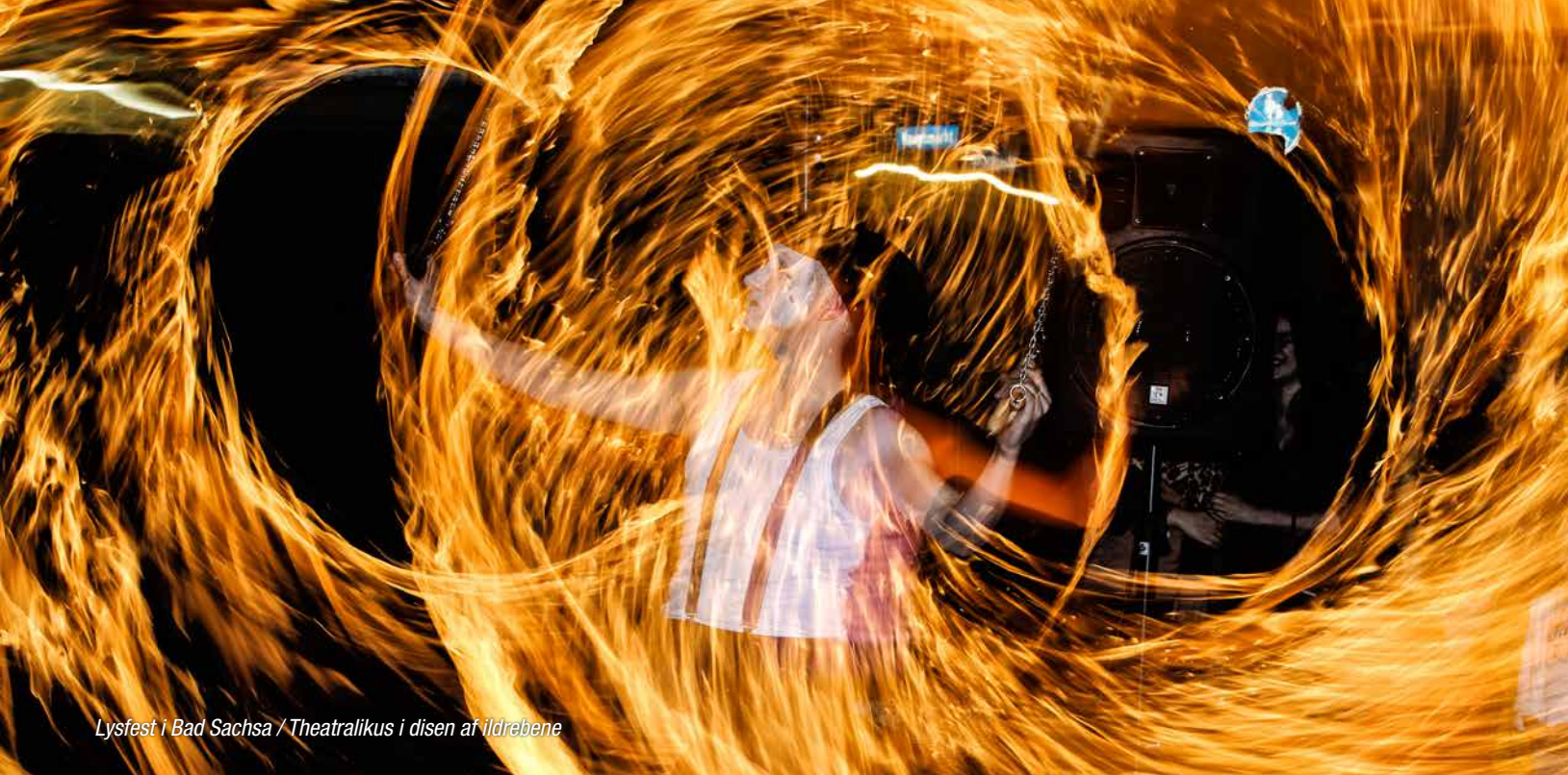
Lysfest i Bad Sachsa / Theatralikus i disen af ildrebene