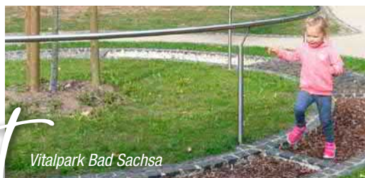
Vitalpark Bad Sachsa