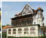
Göbel's Vial Hotel 37441 Bad Sachsa/Harz