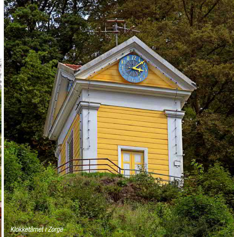
Klokketårnet i Zorge