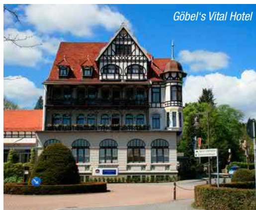
Göbel's Vital Hotel