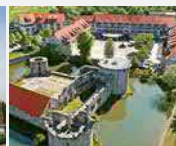
Göbel's Schlosshotel 36289 Friedewald b. Bad Herf.