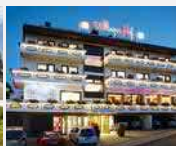
Willinger Hof 34508 Willingen/Upland