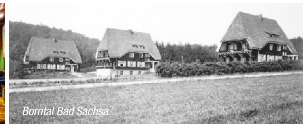
Borntal Bad Sachsa