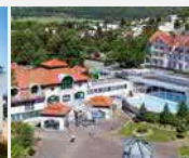
Göbel's Hotel AquaVita 34537 Bad Wildungen-Rhnsn.