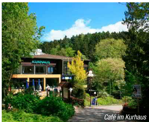
Café im Kurhaus