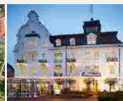
Göbel's Hotel Quellenhof 34537 Bad Wildungen