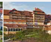
Göbel's Hotel Rodenberg 36199 Rotenburg a. d. Fulda