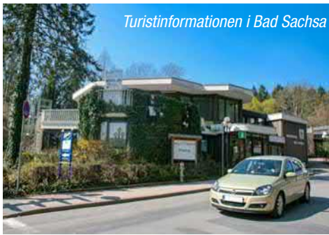
Turistinformationen i Bad Sachsa