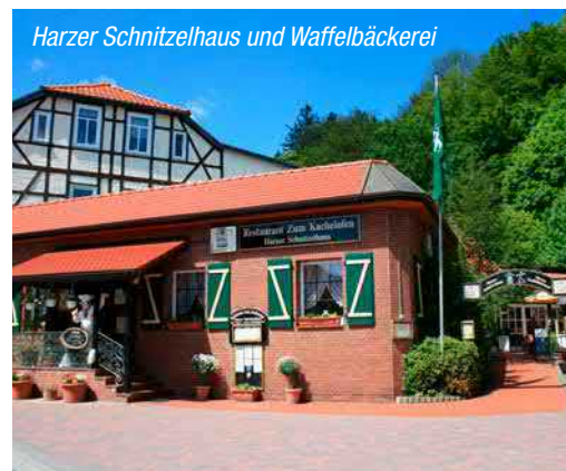
Harzer Schnitzelhaus und Waffelbäckerei