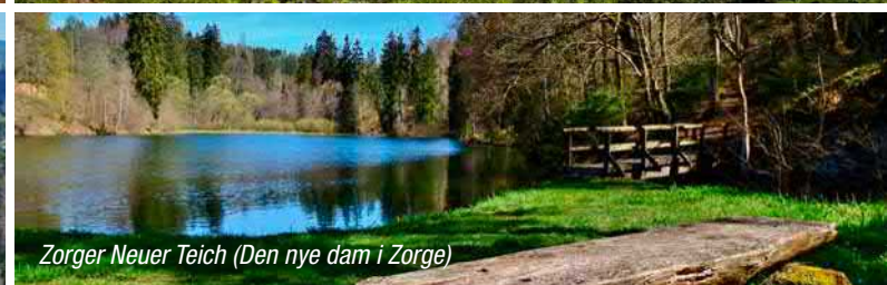
Zorger Neuer Teich (Den nye dam i Zorge)