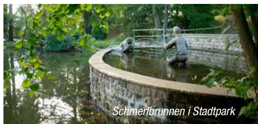
Schmerlbrunnen i Stadtpark