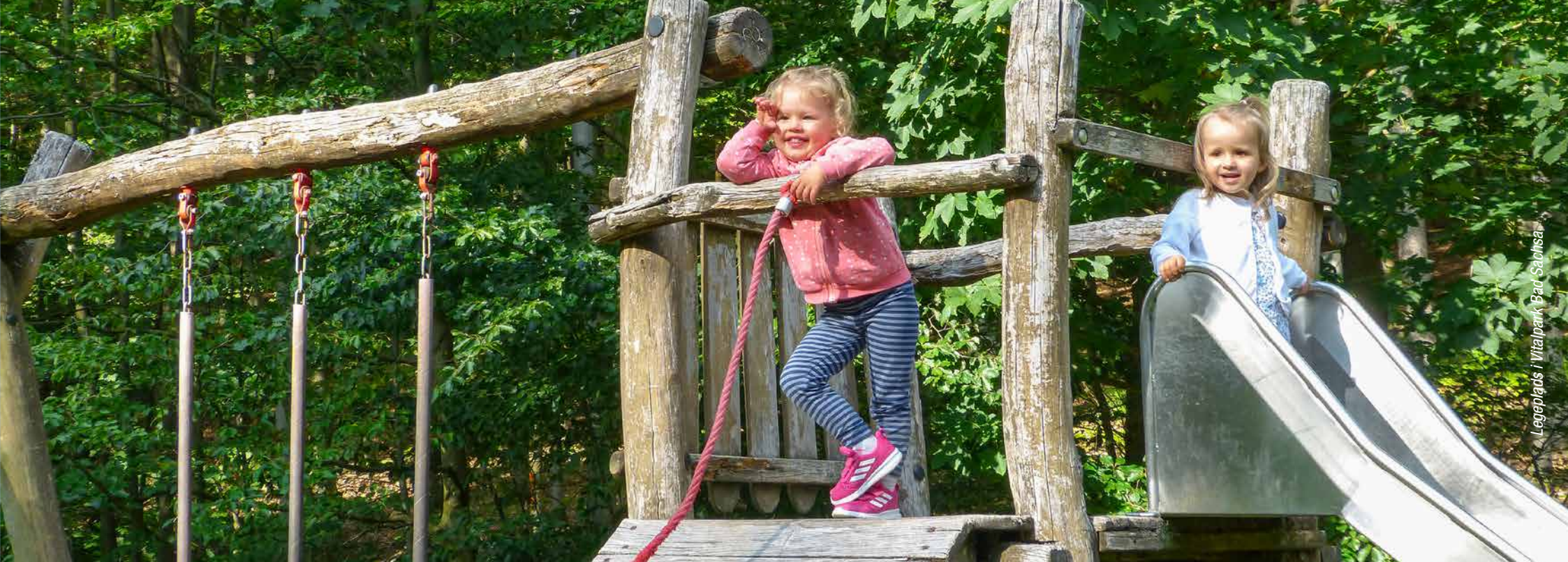
Legeplads i Vitalpark Bad Sachsa

FAMILIEFERIE ENDNU FLERE SJOVE OPLEVELSER I NATUREN