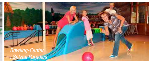
Bowling-Center i Salztal Paradies

Der er udlejning af skøjter og udstyr i alle størrelser.