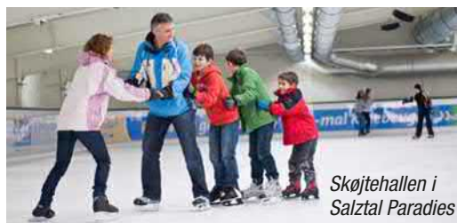
Skøjtehallen i Salztal Paradies

Badelandskabet i Salztal Paradies favner bredt og er rig på afveksling. Det omfatter et inden- og udendørsbassin, eventyrlige vandstrømskanaler, et bølge- og sportsbassin. I action-området og børnebadelandskabet er der fuld gang i den.