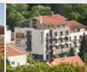
Posthotel Rotenburg 36199 Rotenburg a. d. Fulda