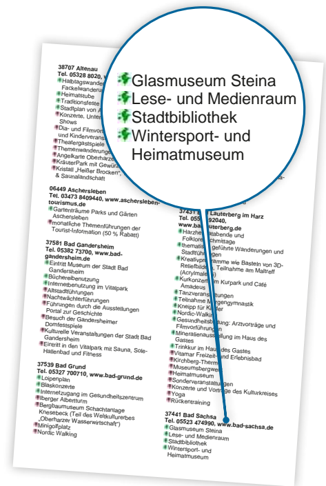
Forbehold for ændringer, Udgave januar 2022.