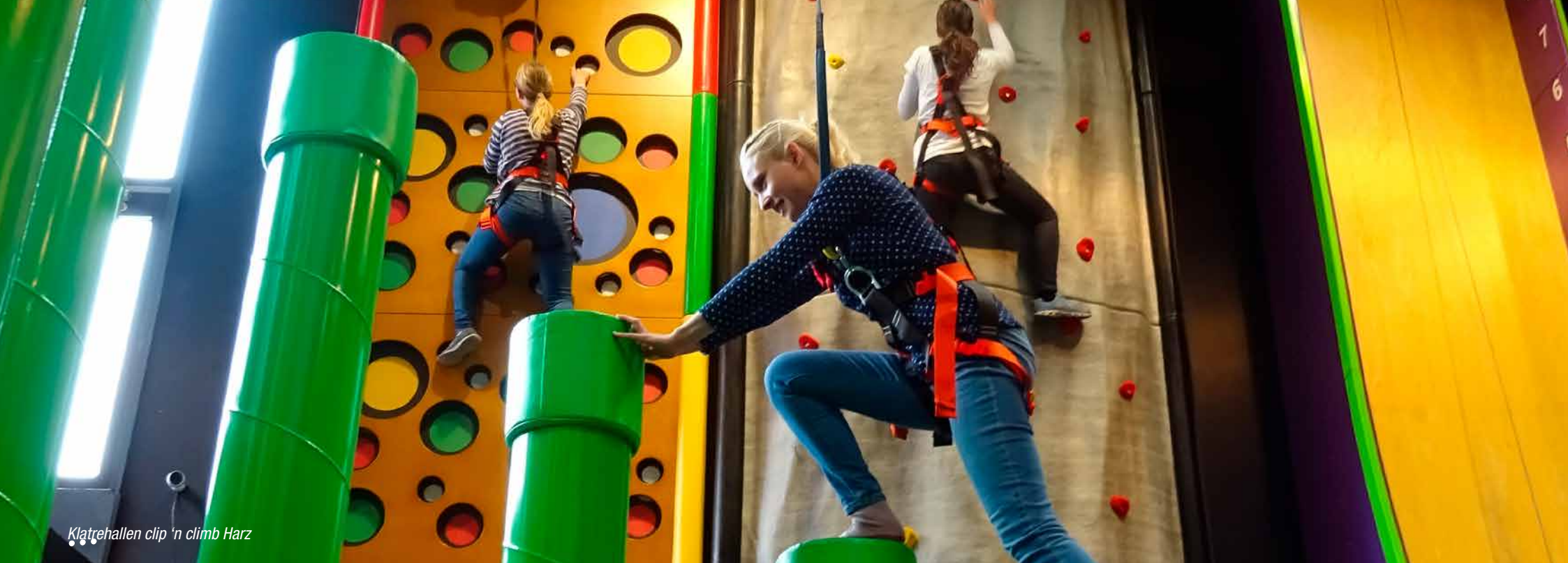
Klatrehallen clip 'n climb Harz