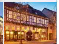
Brauhaus Zum Löwen 99974 Mühlhausen/Thür.