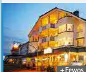
Göbel's Landhotel 34508 Willingen/Upland

Oplev flere Göbel-hoteller – attraktive ferie- og wellnesshoteller i Tysklands smukke hjerte: www.goebel-hotels.de